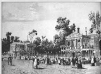
Le café des Ambassadeurs